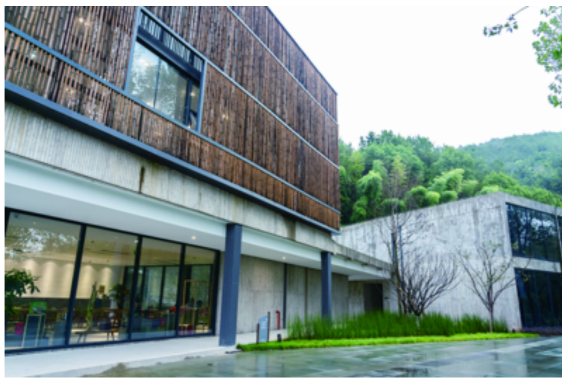
走近美术馆,浓浓的新乡土主义风格扑面而来,以竹为元素的灰白色建筑质朴低调,园林、建筑、艺术相互融合、相得益彰。