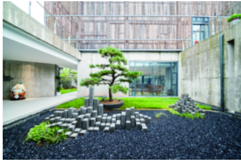
走进馆内,富有生气的围合小庭院、精致的摆设、百转千回的内部结构,别有洞天。