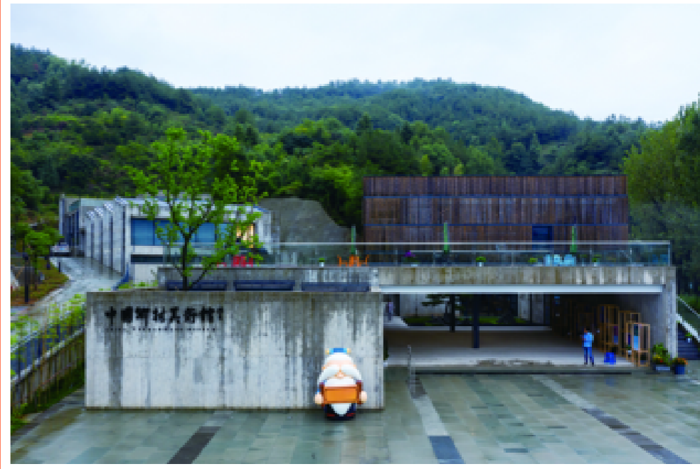
山色空蒙雨亦奇,雨下的美术馆,矗立在群山环抱中,别有一番韵味。